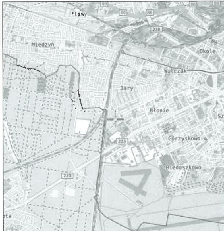
Rys. 1 Lokalizacja badanego obiektu