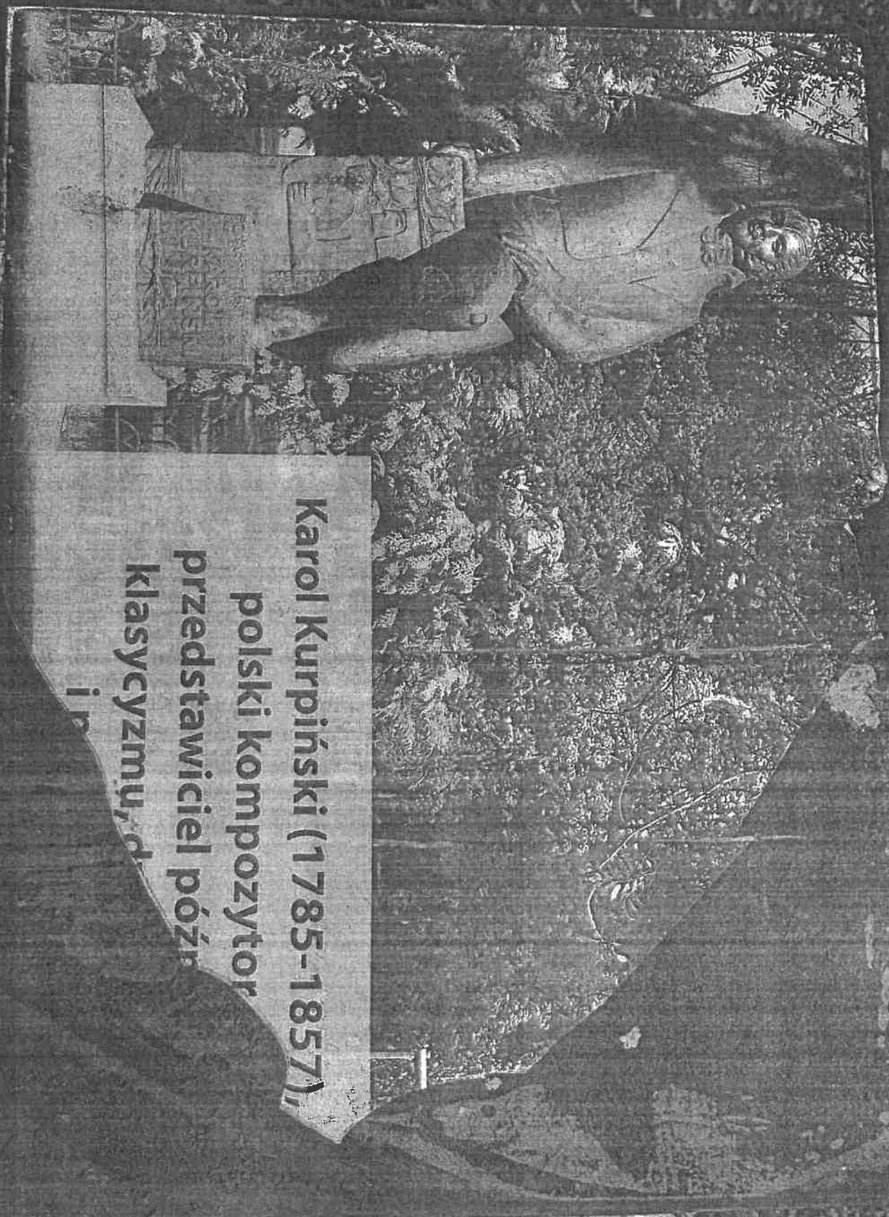
Karol Kurpiński (1785-1857), polski kompozytor przedstawiciel późn klasycyzmu, d ip