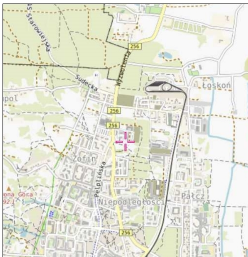
Rys. 1 Lokalizacja badanego obiektu