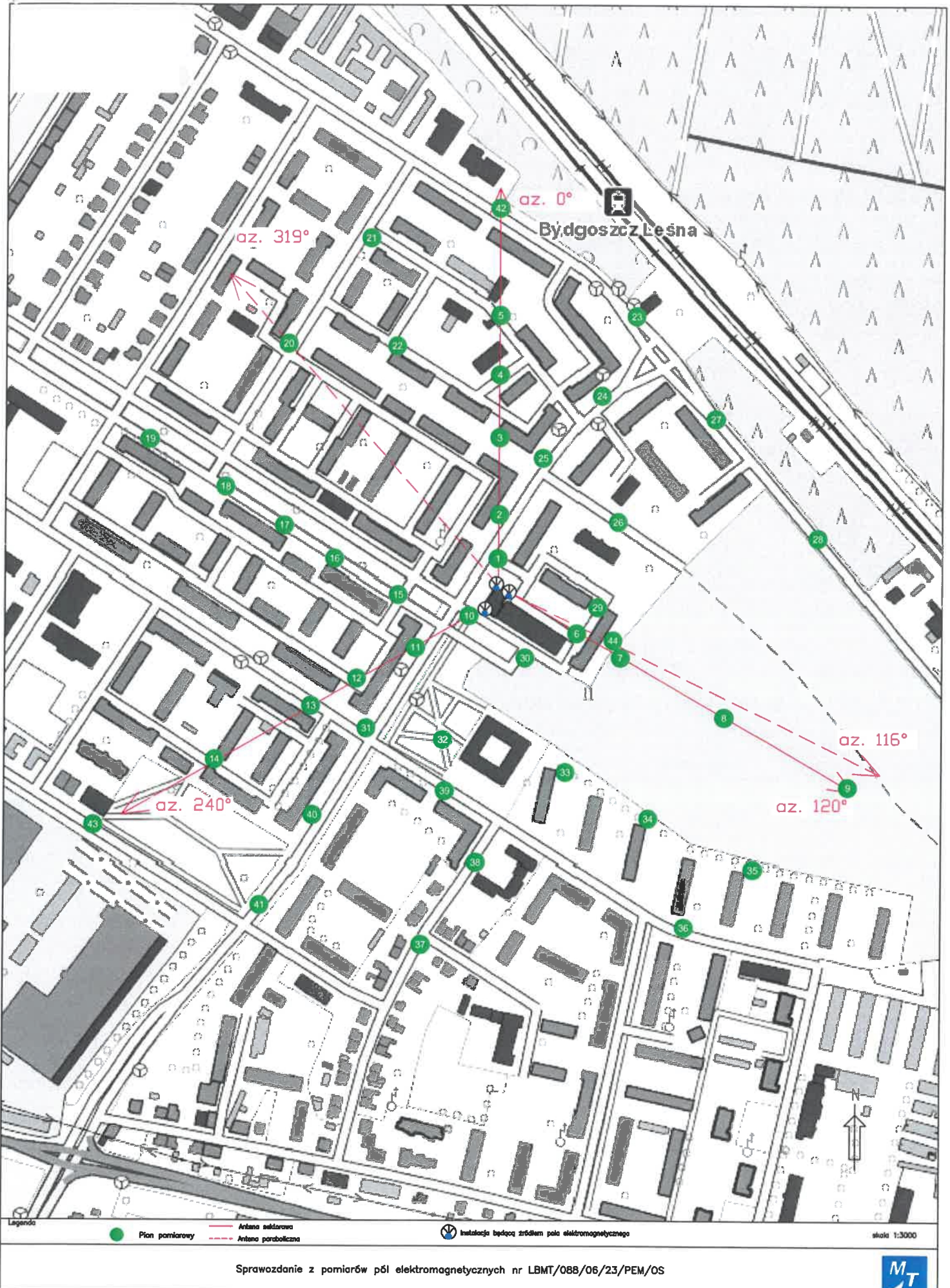
Rys.1 Lokalizacja pionów pomiarowych