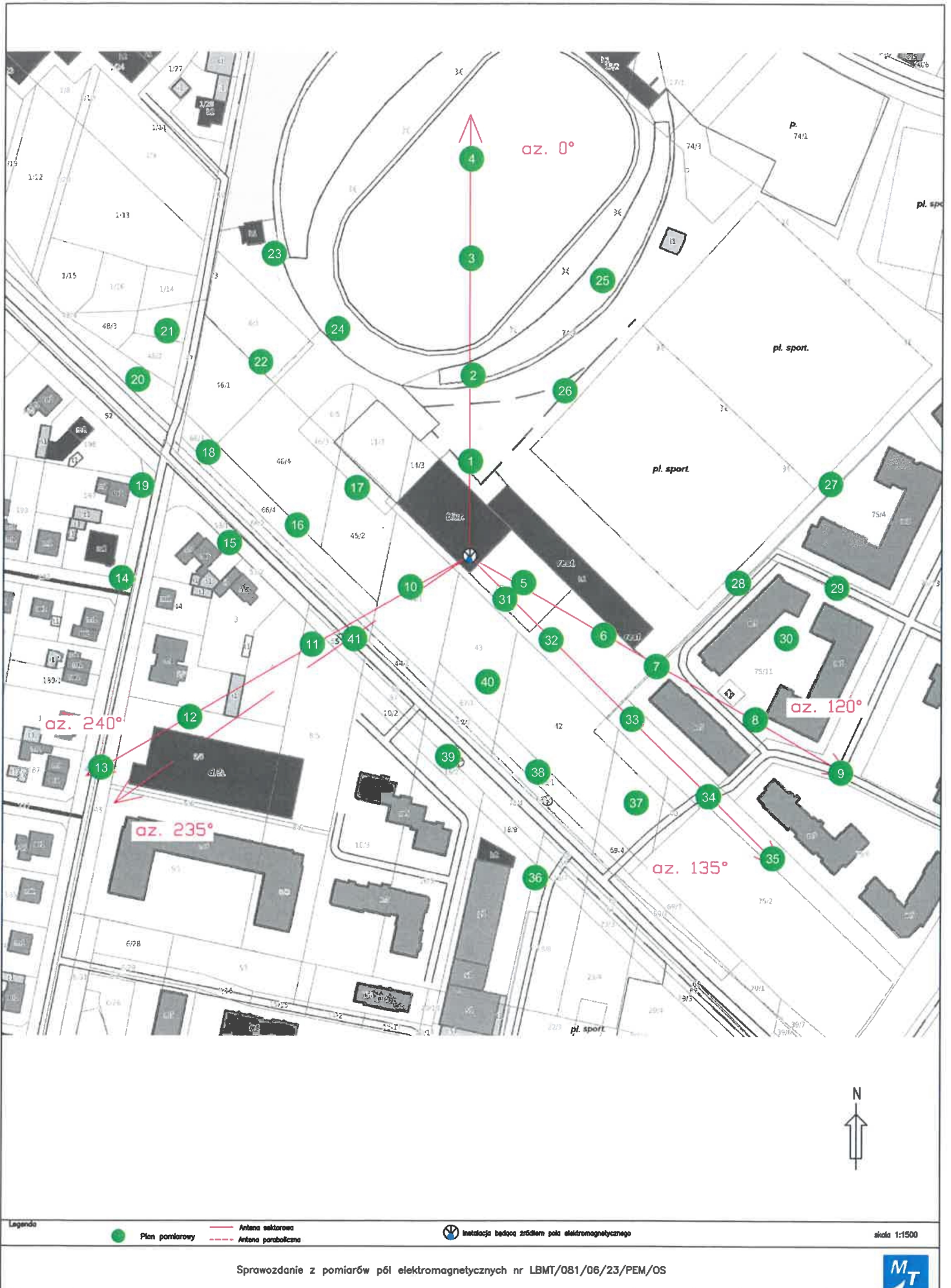
Rys.1 Lokalizacja pionów pomiarowych