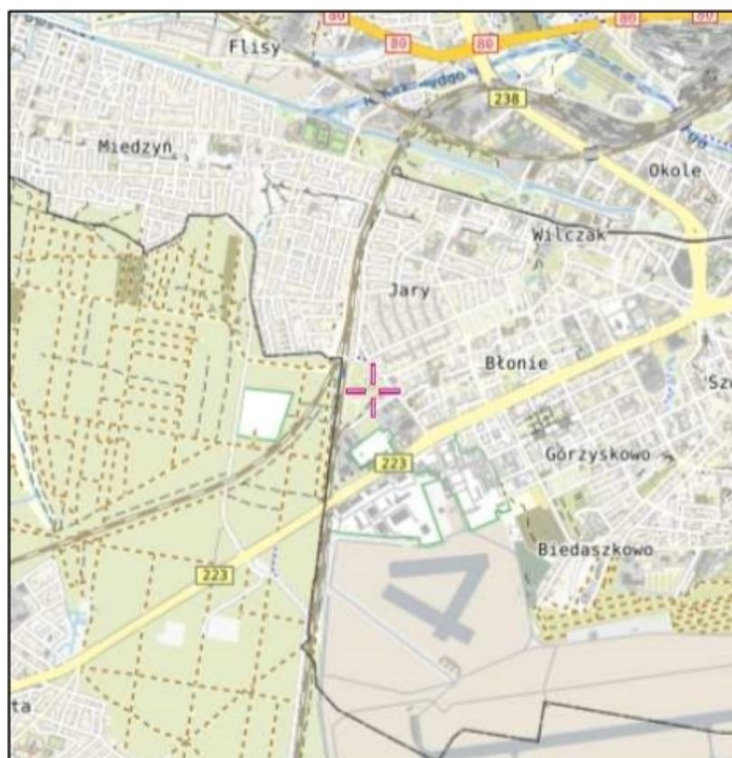
Rys. 1 Lokalizacja badanego obiektu