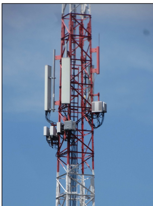
Rys. 3 Widok badanego obiektu