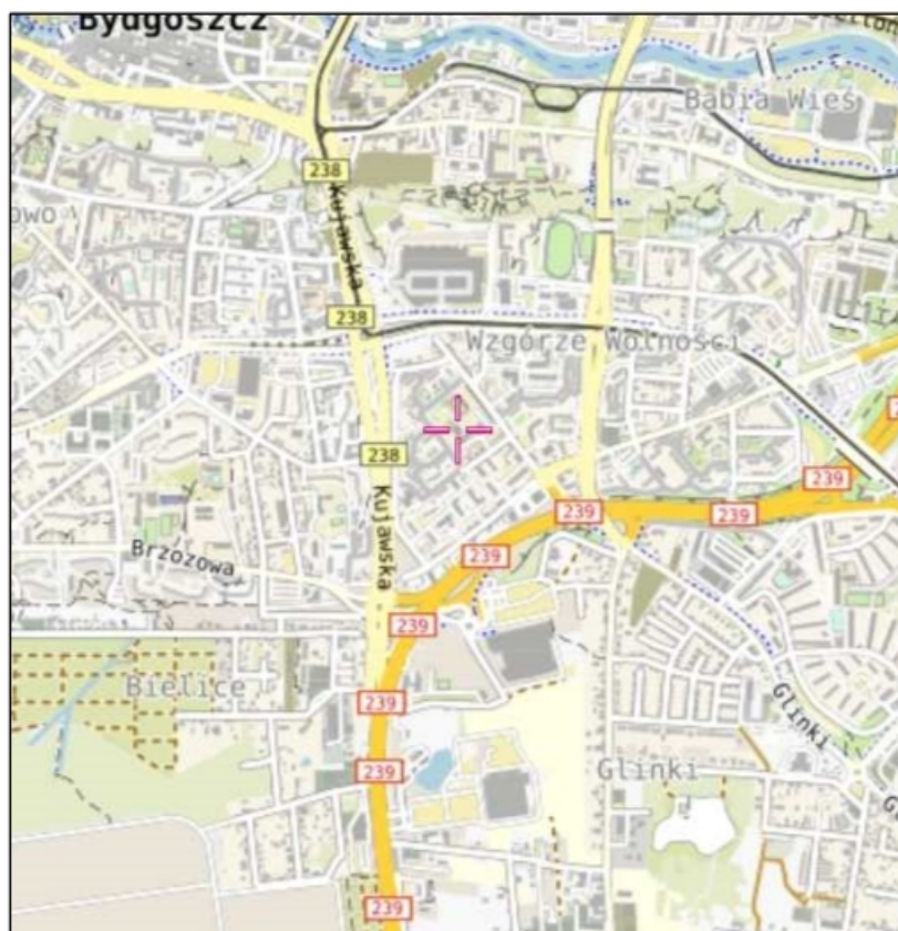
Rys. 1 Lokalizacja badanego obiektu